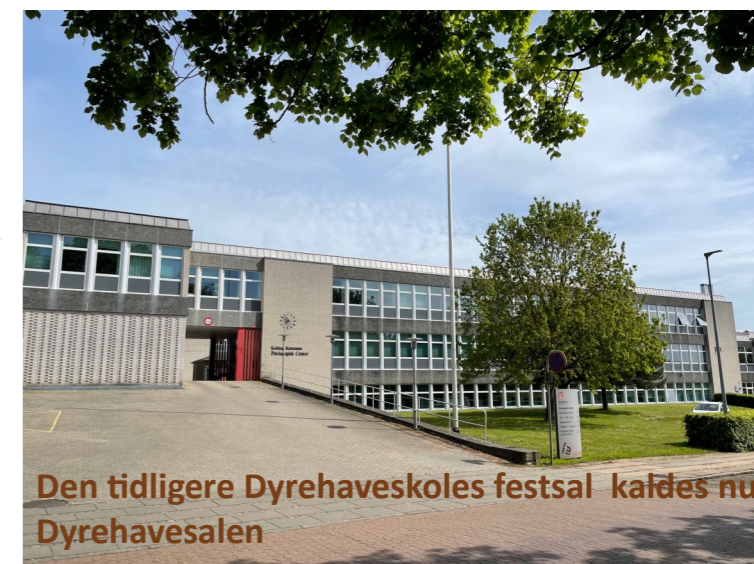
Den tidligere Dyrehaveskoles festsal kaldes nu Dyrehavesalen

Valgmetode: Der kan skrives indtil 6 navne på stemmesedlen. De 6 der opnår højeste stemmetal er valgt som medlemmer af seniorudvalget. De 3 med derefter følgende stemmetal indtræder i rækkefølge som suppleanter.